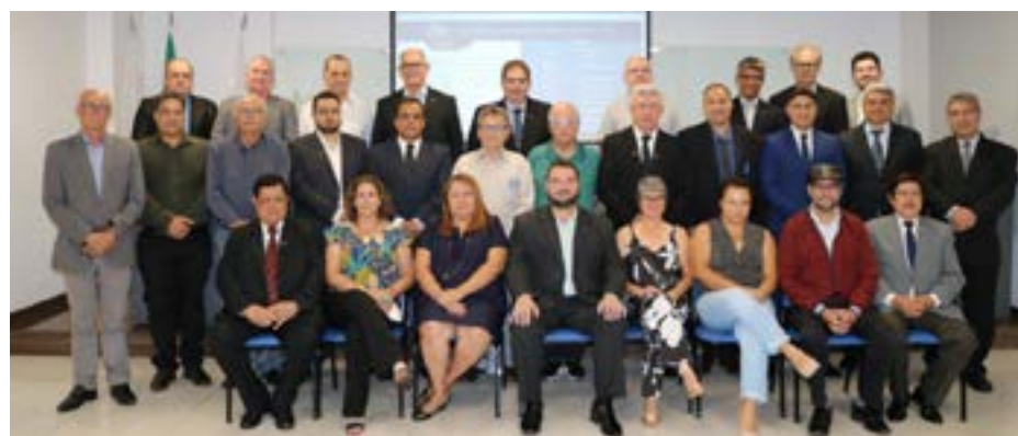
Diretoria Fecon-MG 2023/25