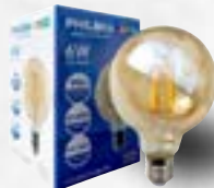
LÂMPADAS DE LED (Até 3 anos de garantia)