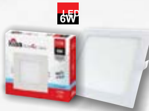
PAINÉIS DE LED