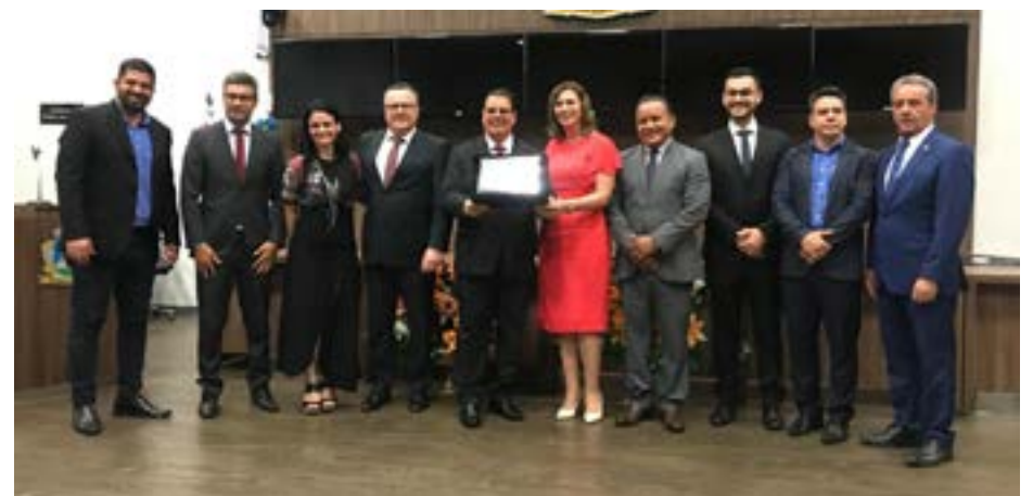
Sessão especial realizada na Câmara Municipal em homenagem aos 10 anos da Sede Administrativa da Igreja Adventista do Sétimo Dia para o Norte e Noroeste de Minas Gerais

A Missão Mineira Norte - sede administrativa da Igreja Adventista do Sétimo Dia para o Norte e Noroeste de Minas Gerais foi inaugurada no dia 15 de novembro de 2012. A História que começou a ser escrita há dez anos está em constante movimento, com a construção, inauguração e reforma de várias igrejas em toda a região.