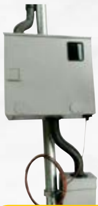
PADRÃO CEMIG (Também para Energia Solar)

Temos tudo que você precisa para sua construção!