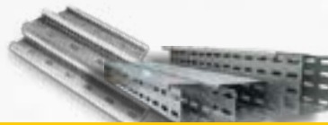
ELETROCALHAS, PERFILADOS, CONDULETES E TUBOS ELETRODUTOS PVC E GALVANIZADOS