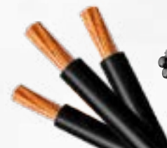
CABOS DE COBRE DE DIVERSAS BITOLAS E SELO INMETRO DE QUALIDADE.