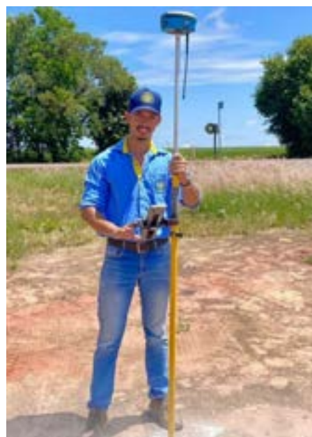
Levantamento Topográfico em Buritis-MG