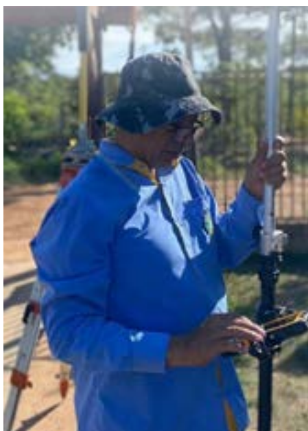
Levantamento Topográfico em Paracatu-MG

Rua Topázio, nº 944 | Bairro Monte Carmelo | Montes Claros/MG (38)99902-8673 (38)99839-6143 E-mail: contato.iterb@gmail.com Siga nosso Instagram: @iterb_brasil