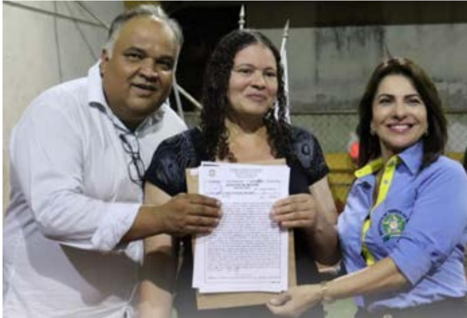
Entrega de títulos do Bairro Centro em Inhaúma-MG