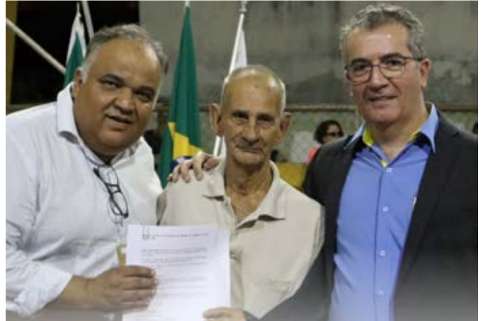
Entrega de títulos do Bairro Chácara da Moradinha em Inhaúma-MG

A Regularização Fundiária Urbana – REURB , normatizada pela Lei Federal nº 13.465/2017, busca regularizar a posse e o uso da terra, garantindo o direito à propriedade e o acesso a serviços básicos para a população.