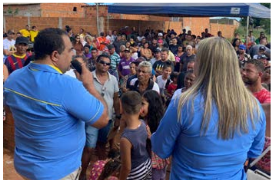
Audiência pública em Planaltina-GO